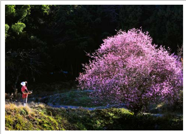
📍 撮影場所：糸島市飯原