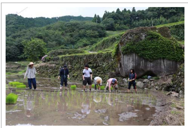
📍 撮影場所：八女市黒木町笠原