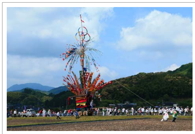
📍 撮影場所：田川郡赤村上赤村