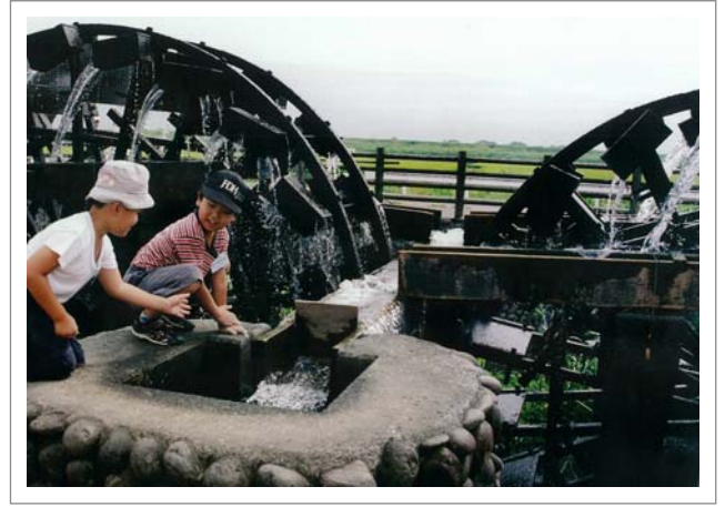
📍 撮影場所：朝倉市三蓮水車