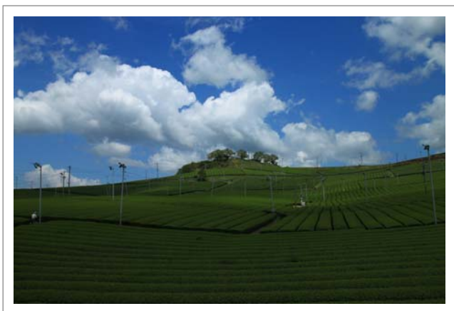
📍 撮影場所：八女市本