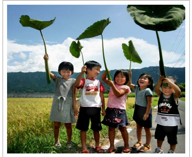
📍 撮影場所：久留米市田主丸町