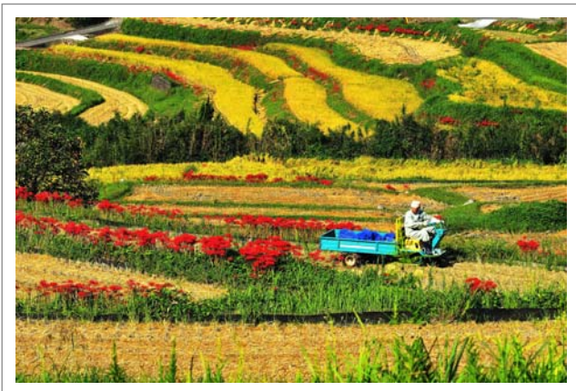
📍 撮影場所：北九州市小倉南区井手浦棚田