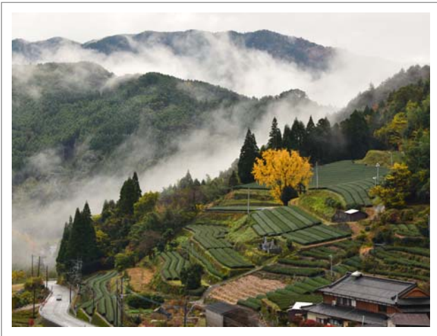
📍 撮影場所：八女市星野村