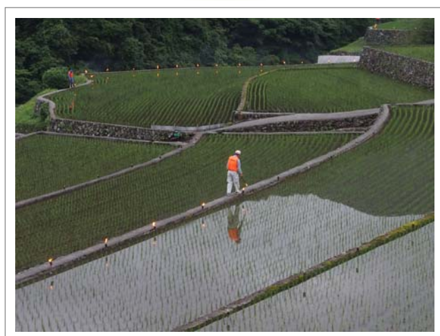
📍 撮影場所：朝倉郡東峰村竹地区