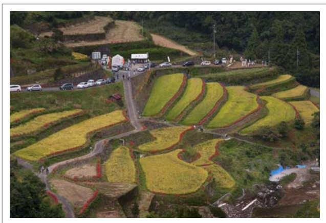
📍 撮影場所：うきは市つづら棚田